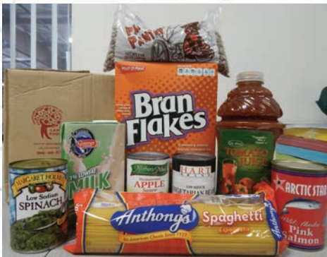
Este es un ejemplo del contenido de una caja de comida mensualmente.